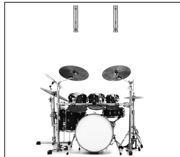
In this diagram, two WA-84's are used in a spaced pair configuration to record stereo drum overheads.

El WA-84 emplea condensadores de orificio pasante Wima, de poliestireno y tantalio de principio a fin.