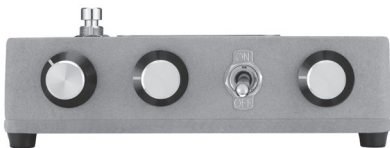
Round 'N Wooly