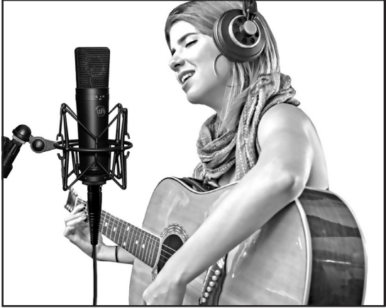
In this image, a vocalist performs into the WA-87 BLACK's at a distance of 12", in cardioid pattern.