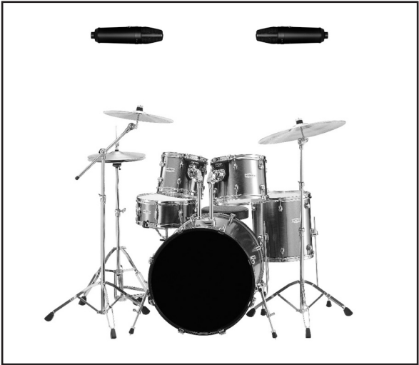
In this diagram, two WA-87 BLACK's are used in a spaced pair configuration to record stereo drum overheads, maintaining equal distance from the snare drum for proper phase.