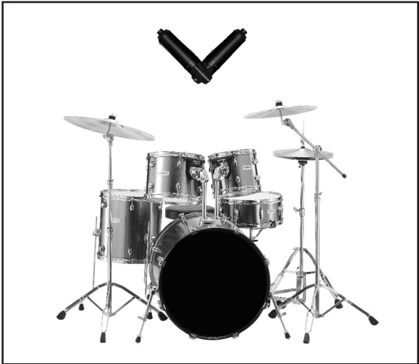
In this diagram, two WA-87 BLACK's are used in a coincident pair, also known as XY configuration, to record stereo drum overheads.