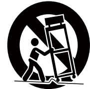
Portable Cart Warning